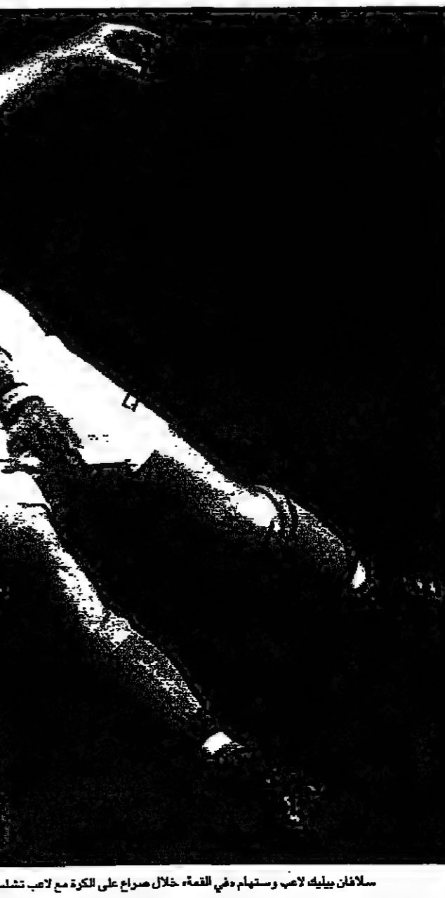
سلافان بليك لاعب وستهام وهي الفناء، خلال صراع على الكرة مع لاعب تشلسي، جيانلوكا بيليلي، في المباراة التي انتهت بفوز وستهام 3-4.

فيينا - اف ب: خسر رايب فيينا امام ضيفه غاك صغرى 1 في المرحلة الحادية والعشرين من الدوري النمساوي لكرة القدم وفي مستصدا بفارق الاهداف عن سالزبورغ الذي فاز على ايني 2/صفر.